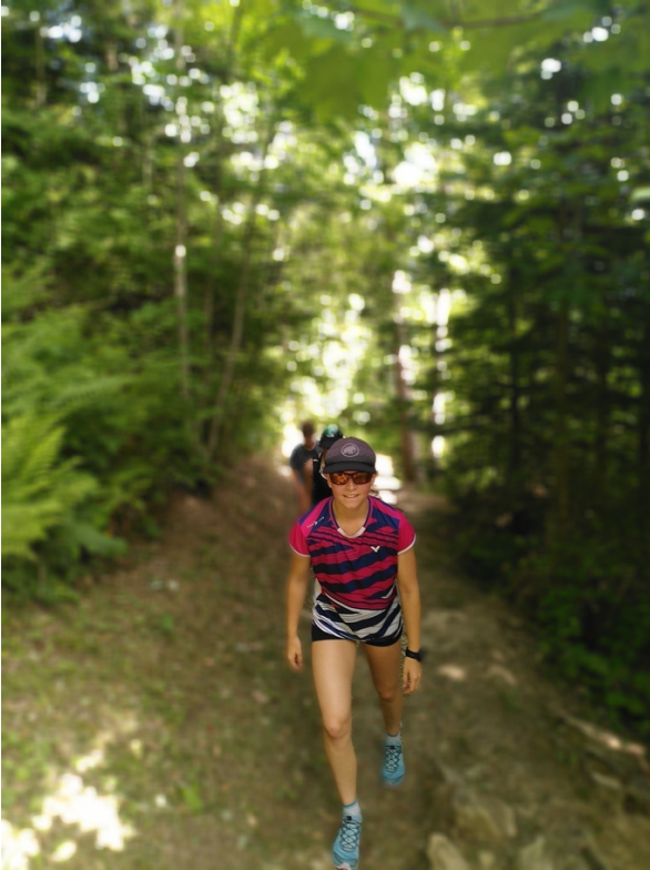
Der untere Teil der Strecke verläuft zum Glück im Wald.

Tolle Sache! Muskelkater? Ist leider zu erwarten... Kamele haben wir übrigens trotz Sahara-Klima keine gesehen!