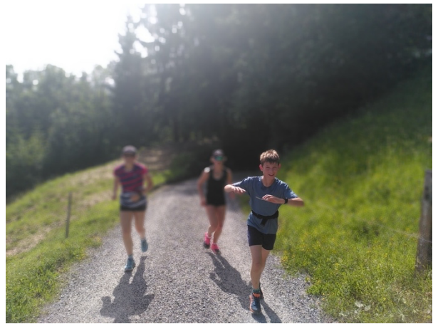
Solche bequeme Wege gibt's nur ganz am Anfang. Der Lauf auf den Niesen ist ein echter und harter Trailrun! Gratulation allen Teilnehmenden!